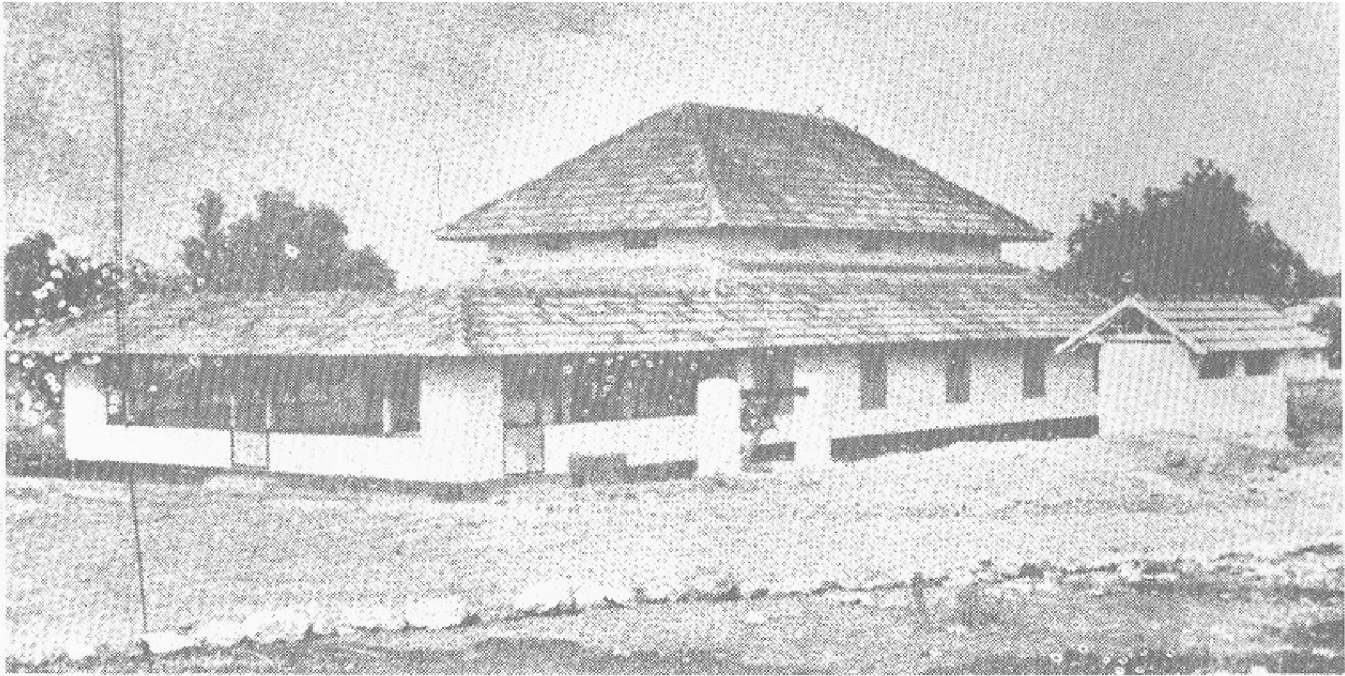
Al-Azhar Mosque 1951 : The Muezzin Calls.....

ഫാറൂഖ് കോളേജ് കാമ്പസിൽ തലയുയർത്തി നില്ക്കുന്ന വിവിധ വിദ്യാഭ്യാസസ്ഥാപനങ്ങൾ; അവയുടെ മധ്യത്തിൽ കേന്ദ്രിയുടെ സംഗീതം പൊഴിക്കുന്ന മനോഹരമായ മസ്ജിദുൽ അസ്ഹർ; ആത്മീയതയുടെ പ്രതീകമായി ഉത്തുംഗതയിലേക്ക് എത്തിനോക്കുന്ന രണ്ടു മിനാരങ്ങൾ - ഒരേ സമയം മതവും ശാസ്ത്രവും, കലയും സാഹിത്യവും, വിജ്ഞാനവും സംസ്കാരവും, കേന്ദ്രിയം പ്രാർത്ഥനയും, പ്രണാമവും കീർത്തനവും എല്ലാം സങ്കല്പിച്ചു രൂപംകൊണ്ടു വിശിഷ്ടമായ ഒരു സാംസ്കാരികാന്തരീക്ഷം. ഒരു പള്ളി സർവ്വകലാശാലയായി മാറിയതാണല്ലോ ഈജിപ്തിലെ അൽ-അസ്ഹർ. കേരളത്തിലെ അൽ-അസ്ഹർ എന്ന് വിശേഷിപ്പിക്കപ്പെടുന്ന മഹത്തായ ഒരു വിജ്ഞാനകേന്ദ്രത്തിലെ പള്ളിക്ക് 'മസ്ജിദുൽ അസ്ഹർ' എന്നനാമം എത്ര അമ്പർത്ഥമായിരിക്കുന്നു.