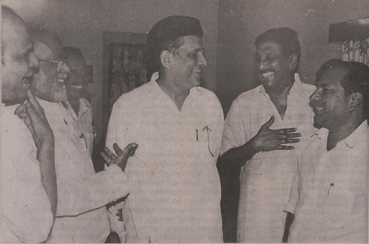
ശിഹാബ് തങ്ങൾ, ബാലകൃഷ്ണപിള്ള, എ.കെ. ആന്റണി, കെ. ശങ്കരനാരായണൻ