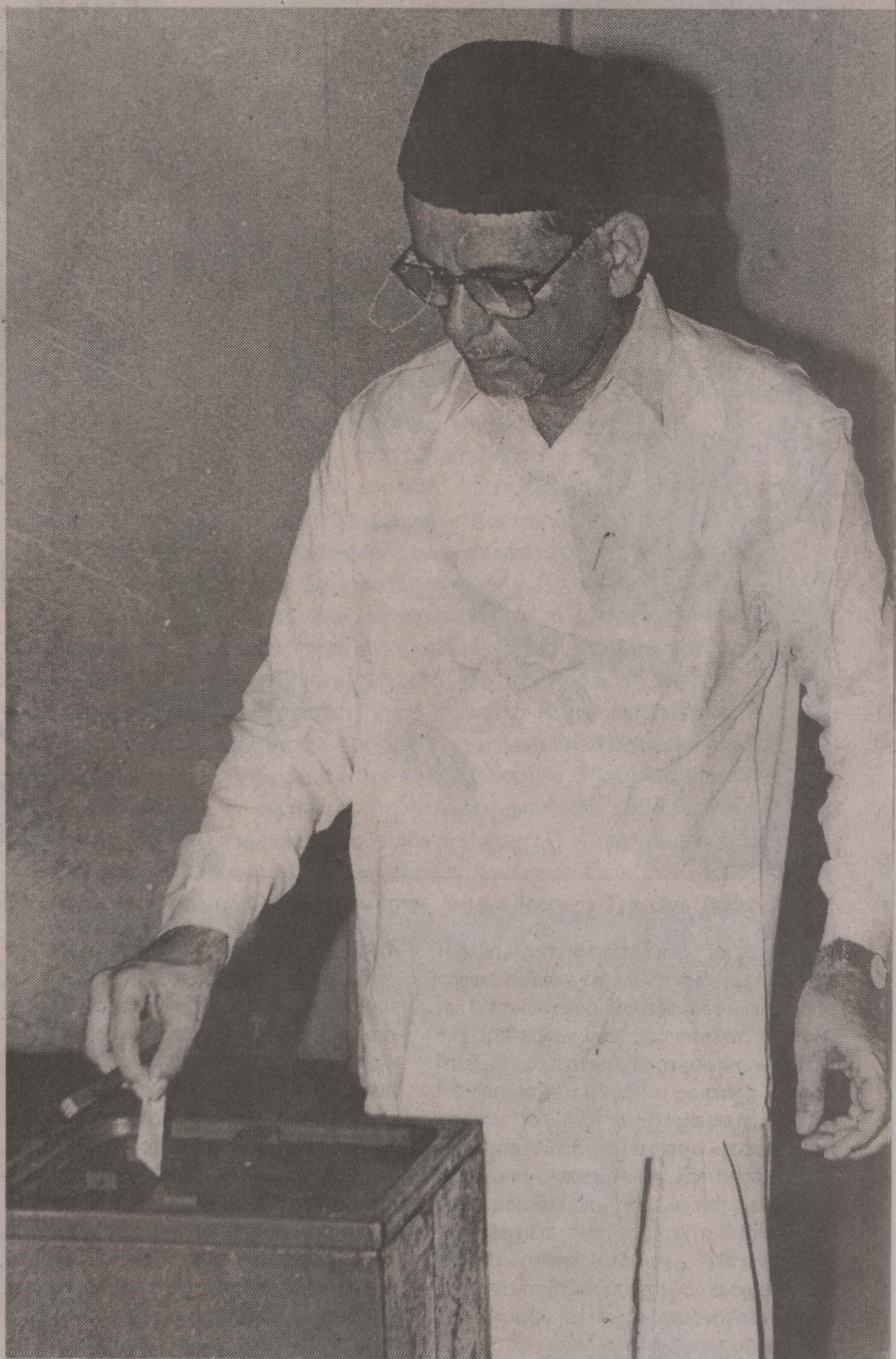
വർഗീയപ്പാർട്ടിയെന്ന് പലപ്പോഴും ആക്ഷേപിക്കപ്പെടുന്ന ഒരു വലതുപക്ഷ രാഷ്ട്രീയ പ്രസ്ഥാനത്തിന്റെ അമരക്കാരൻ മതസൗഹാർദത്തിന്റെ പ്രതിരൂപമായി വാഴ്ത്തപ്പെടുന്നത് അമ്പരപ്പിച്ച് സൃഷ്ടിക്കാതിരിക്കുന്നില്ല. എങ്കിലും പാണക്കാട് ശിഹാബ് തങ്ങളുടെ വിനയമധുരമായ കാൽവെപ്പുകൾ ഈ അമ്പരപ്പുകളെ മാർച്ചുകളാക്കുന്നു. ഭാവിയിൽ ശിഹാബ് തങ്ങൾ ഓർമ്മിക്കപ്പെടുക ഒരു സാമൂഹിക രാഷ്ട്രീയ കക്ഷിയുടെ നേതാവെന്ന നിലയിലോ ആത്മീയാചാര്യനെന്ന നിലയിലോ അല്ല, മറിച്ച് കേരളത്തിലെ മതേതര ചിന്തയുടെ മുന്നണിപ്പോരാളികളിൽ ഒരാളായിട്ടായിരിക്കും.