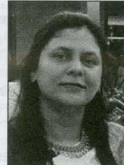
ഷീലുജാസ് എം. ഫാറൂഖ് കോളേജ്, കോഴിക്കോട്

ലോകത്ത് ഏറ്റവും കൂടുതൽ ദാരിദ്ര്യം അനുഭവിക്കുന്നവരും കൂടുതലായി കാർഷികവൃത്തിയിലേർപ്പെടുന്നവരും സ്ത്രീകളാണ്. അതുകൊണ്ടുതന്നെ കാലാവസ്ഥാ വ്യതിയാനത്തിന്റെ പ്രധാന ഇരകളും അവർതന്നെ. കുടുംബാംഗങ്ങൾക്കാവശ്യമുള്ള ആഹാരസാധനങ്ങൾ കത്തുന്നതും ശേഖരിക്കുന്നതും അവ പാകം ചെയ്യുന്നതടക്കമുള്ള ഭാരിച്ച ഉത്തര