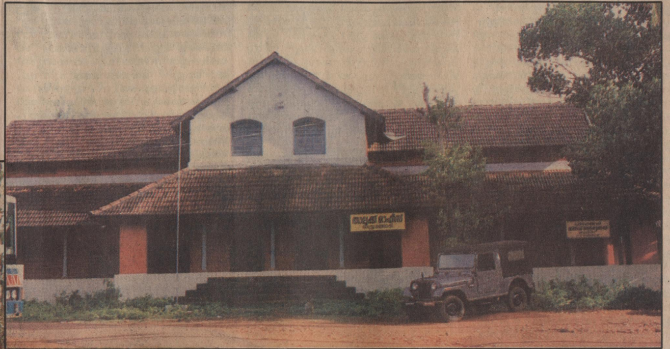
കലാപകാരികളുടെ വിചാരണ നടന്ന തിരുരങ്ങാടി കച്ചേരി