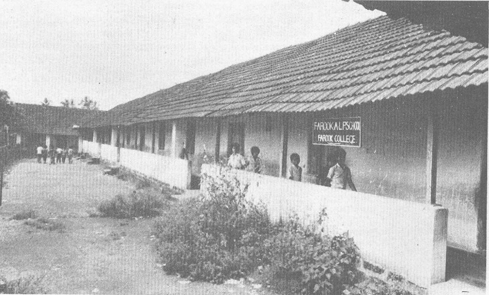
Farook A.L.P. School : .....and kids.