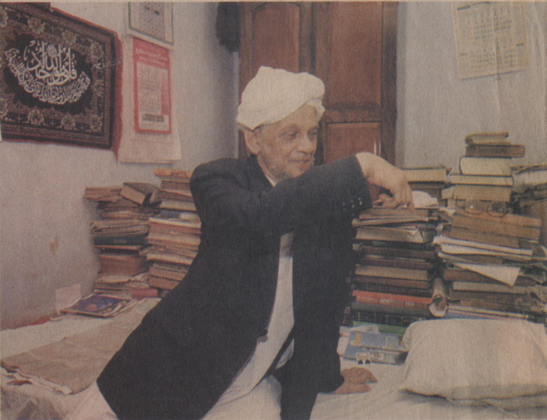
വലിയവാസി പഴയ രേഖകൾക്കു നടുവിൽ

ദിനമതങ്ങൾ കൈകോർത്തുനിൽക്കുന്ന കോഴിക്കോട്ട് ഇസ്ലാമിക ദർശനങ്ങൾ മുറുകെ പിടിച്ചുതന്ന മതസൗഹാർദ്ദത്തിന്റെ സർഫലങ്ങൾക്കു വിളയൊരുകാനും അദ്ദേഹം ശ്രദ്ധിച്ചുപോന്നു. മാത്രമല്ല, സമുദായത്തിൽ തന്നെയുള്ള വ്യത്യസ്ത വീക്ഷണഗതികൾക്കു യോജിപ്പിന്റെ മേഖലകൾ തുറന്നു കൊടുക്കാനും സാധിച്ചു. കുറ്റിച്ചിറയുടെ ഇരു കരകളിൽ ചരിത്രത്തിന്റെയും പാരമ്പര്യത്തിന്റെയും പെരുമകൾ പൊഴിയുന്ന ജുമുഅത്ത് പള്ളിയും മിസ്കാൽ പള്ളിയും കേ