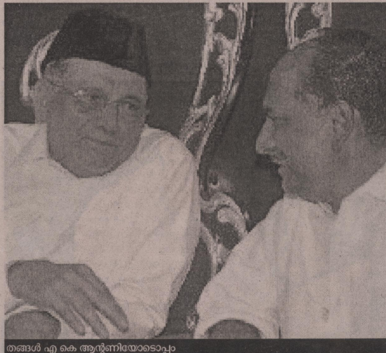
തങ്ങൾ എ കെ ആന്റണിയോടൊപ്പം

തങ്ങളുടെ നിര്യാണത്തിലനുശോചിച്ച രാഷ്ട്രപ്രതിയും പ്രധാനമന്ത്രിയും ആന്റണിയും അച്ഛതാനന്ദനും പിണറായിയും ബി ജെ പി നേതാക്കളും ക്രിസ്തീയ മതാധ്യക്ഷന്മാരും ഒക്കെ ഒരേ സ്വരത്തിൽ പറഞ്ഞ കാര്യം, മതേതരത്വത്തിന്റെ സംരക്ഷണത്തിന് തങ്ങൾ ചെയ്ത മഹത്തായ സേവനത്തെക്കുറിച്ചായിരുന്നു. മാധ്യമങ്ങൾ മുഴുകെ ഉയർത്തിപ്പിടിച്ചത് ഇക്കാര്യമായിരുന്നു. ഒരുപക്ഷേ സമീപകാലത്ത് സി എച്ച്.എൻ മാത്രമേ മുസ്ലിംസമുദായത്തിൽ ഈ തൊപ്പി നേടാൻ കഴിഞ്ഞിട്ടുള്ളൂ. ബാബരി പള്ളി തകർത്ത സന്ദർഭത്തിൽ വിദേശ രാജ്യങ്ങളിൽപോലും പ്രശ്നങ്ങളുണ്ടായ