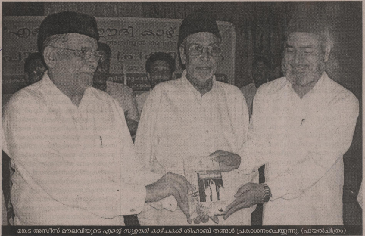
മകട അസീസ് മൗലവിയുടെ എന്റെ സുൽതാദി കാഴ്ചകൾ ശിഹാബ് തങ്ങൾ പ്രകാശനംചെയ്യുന്നു. (ഫയൽചിത്രം)