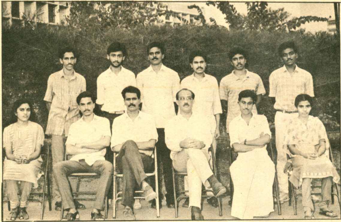
കോളേജ് യൂനിയൻ എക്സിക്യൂട്ടീവ്

ഈ കലാലയത്തിലെ വിദ്യാർത്ഥികളെ അലട്ടുന്ന മനോരമ ദുരിതമാണ് യാത്ര. ഫസ്റ്റ് അമ്പർ ക്ലാസിലെത്താനാവതെ വലിയൊരു ധാരാളം സഹോദരങ്ങൾ എന്റെ മനസ്സിലുണ്ട്. മലപ്പുറത്തു നിന്നും കോഴിക്കോടു നിന്നും കോളേജ്