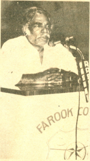
ഫൈൻ ആർട്ട്സ് ക്ലബ്ബ് ഉദ്ഘാടനം : കെ.എ.കൊടുങ്ങല്ലൂർ

9.01. 89 ന് സാംസ്കാരിക വിനിയമത്തിന് കോളേജ് യൂനിയൻ വേദിയൊരുക്കി. കലിക്കൻ സർവ്വ