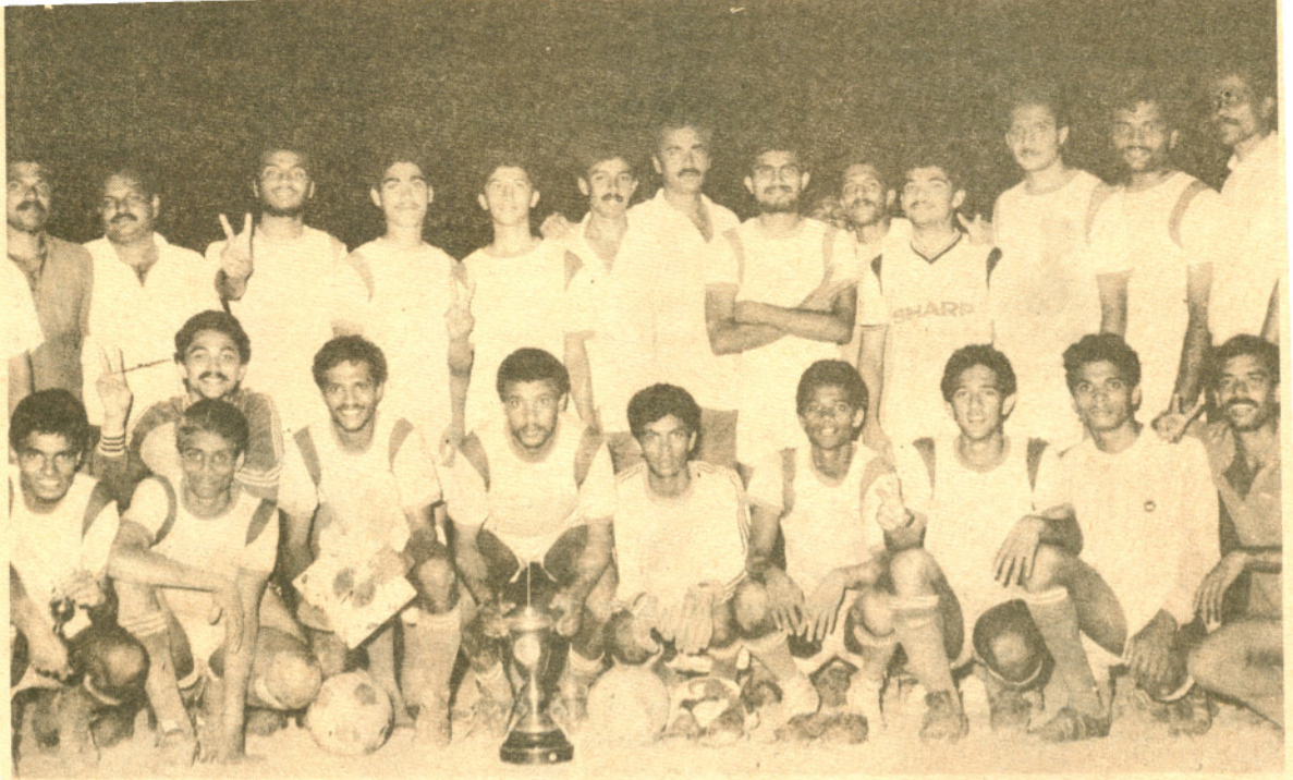
തുടർച്ചയായി രണ്ടാം തവണയും യൂണിവേർസിറ്റി ചാമ്പ്യന്മാരായ ഫാറൂഖ് കോളേജ് ഫുട്ബോൾ ടീം

അതുപുർത്തമി കരച്ചിട്ടില്ല. ഇനി അതിൽ ഞങ്ങളും പ്രതീക്ഷയർപ്പിക്കുന്നു.