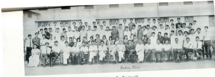
Senior Pre-Degree 55