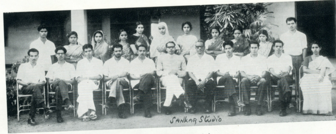
Senior M. Sc. (Mathematics)