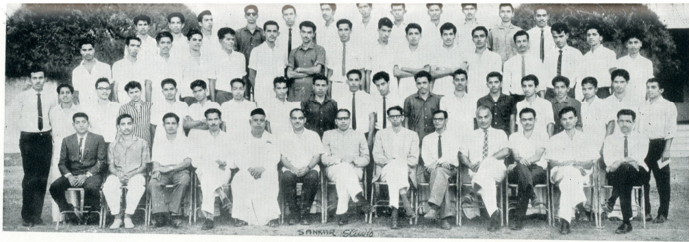
Final B. Com.