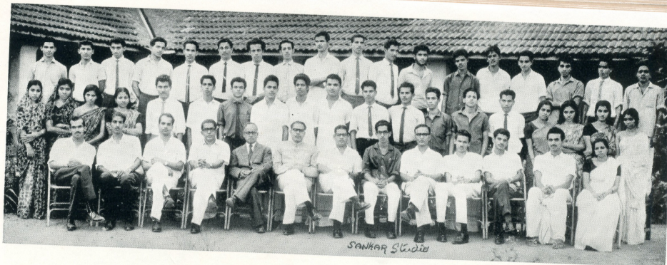
Final B. Sc. Zoology