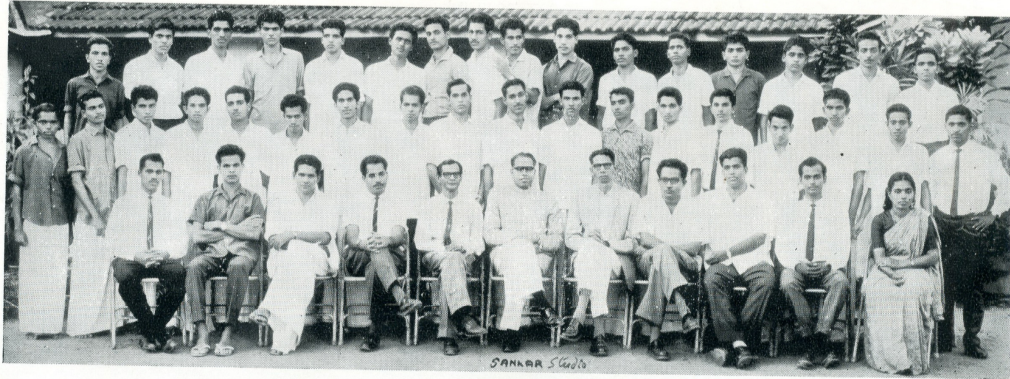
Final B. A. ( Economics )