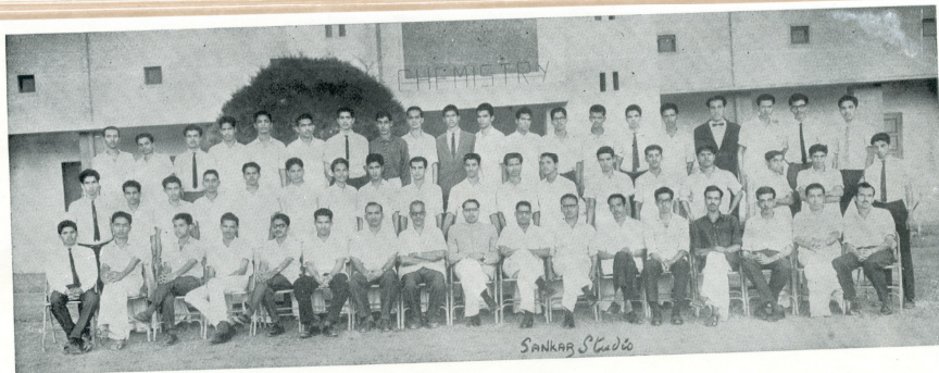
Final B. Sc. (Chemistry)