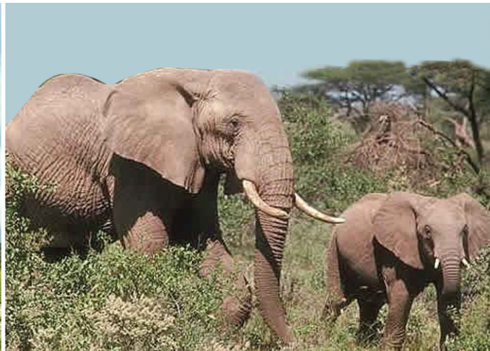
ആഫ്രിക്കൻ ആന (Forest Elephant)

IUCN ന്റെ (2007) കണക്ക്. ഇതിൽ ഭൂരിപക്ഷവും കിഴക്കൻ ആഫ്രിക്കയിലും, തെക്കൻ ആഫ്രിക്കയിലുമാണ് കാണപ്പെടുന്നത്. ഇവയുടെ എണ്ണത്തിൽ കാര്യമായ വർധനവുണ്ടാകുന്നതായാണ് കണക്കുകൾ സൂചിപ്പിക്കുന്നത്.