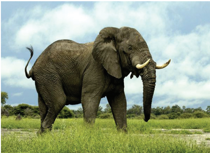
ആഫ്രിക്കൻ ആന (Savanna Elephant)