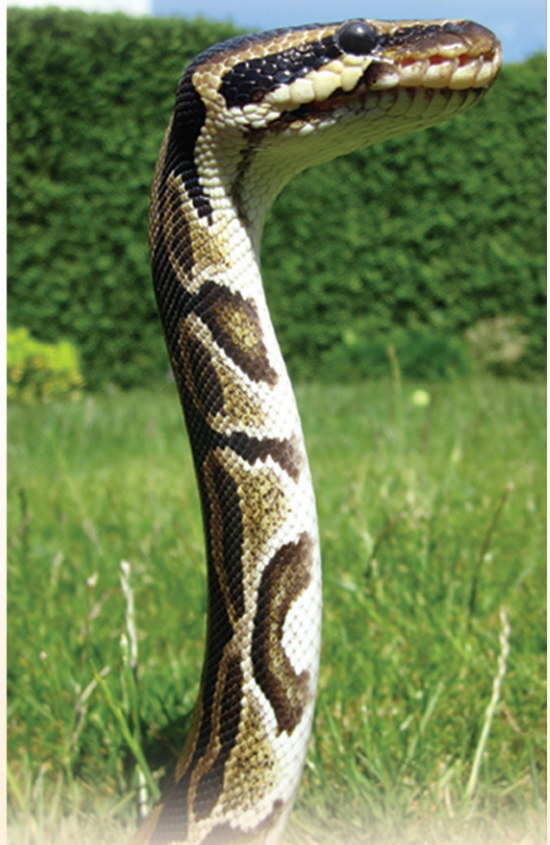
കോർ മേഖലയിൽ സൈരവിഹാരം നടത്തുന്ന പാമ്പ്

സങ്കേതത്തിന്റെ കേന്ദ്രഭാഗമാണിത്. യാതൊരു വിധ ബാഹ്യ ഇടപെടലുകളും ഇവിടെ അനുവദനീയമല്ല. എന്നുപറഞ്ഞാൽ അങ്ങോട്ടു നമുക്ക്