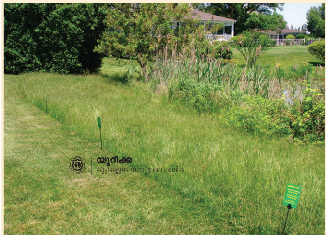
ബഫർ മേഖലയ്ക്കടുത്ത് മനുഷ്യവാസമുള്ള സ്ഥലം

ടൂറിക്ക് കൂട്ടിക്കൂടെ രാത്രിയിലെത്തിക്കാം