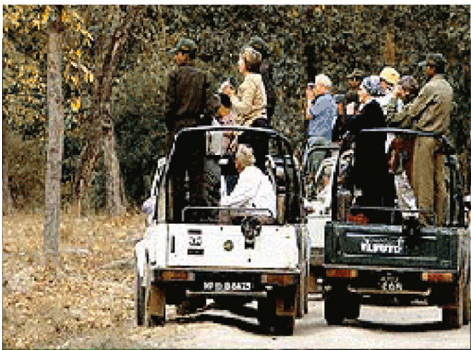
വന്യജീവികളെ കാണാൻ വാഹനങ്ങളിൽ

പീക്നിക മേഖലയിൽ നിന്ന് ടൂറിസ്റ്റുകൾക്ക് വനംവകുപ്പ് ഏർപ്പാട് ചെയ്യുന്ന വാഹനങ്ങളിലോ, ബോട്ടിലോ, ചങ്ങാടങ്ങളിലോ സഹായികളുടെ കൂടെ യാത്ര ചെയ്ത് വന്യജീവികളെ കാണാൻ പോകാം. അതിനുവേണ്ടി അനുവദിച്ചിട്ടുള്ള പ്രദേശമാണ് ടൂറിസം മേഖല. മൃഗങ്ങളുടെ സാന്നിധ്യം സാധാരണയായുള്ളതും താരതമ്യേന അപകടര